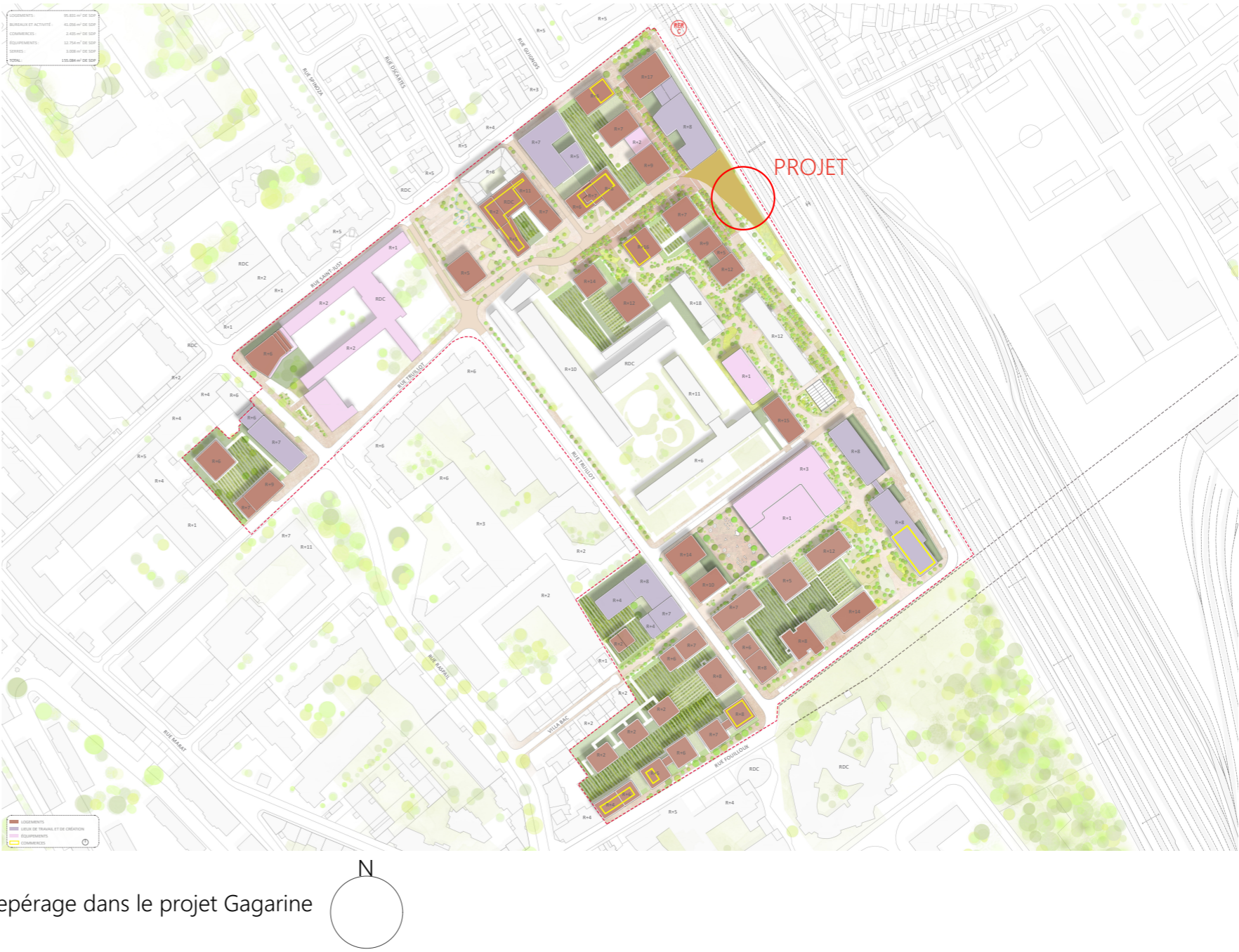
repérage dans le projet Gagarine